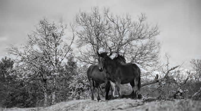
Sans titre © Louise Honée